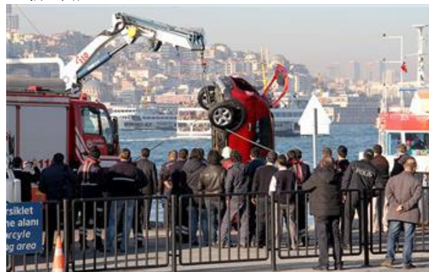
(HD紙インターネット版より)

事故を受けて検察当局は船長他3名の乗務員の逮捕を要求したが、裁判所はこれを却下し、船長に対して海外出国禁止の条件を付した上、身柄の拘束を解いた。(3月17日付HD紙2面)