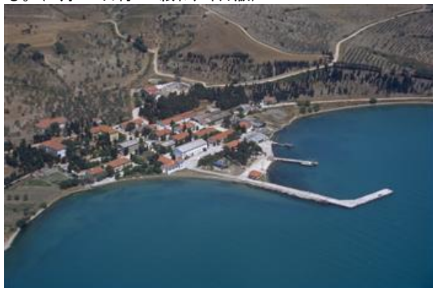
(HD紙インターネット版より)

オジャラン首領は国家反逆罪で訴追を受け、現在、仮釈放なしの終身刑でマルマラ海のイムラル島に収監されている。(3月18日付HD紙インターネット版)