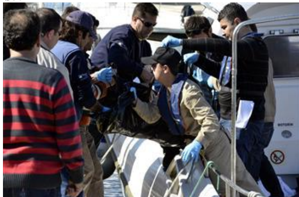
(HD紙インターネット版より)

近年、シリア難民等の増加により、トルコ国内で移民船の転覆事故は増加傾向にあり、シリア人、アフガニスタン人難民等が命の危険を冒して欧州入国を強行している。1月にはアフガニスタン人移民12名が犠牲となった移民船転覆事故も発生した。(3月19日付HD紙1面)