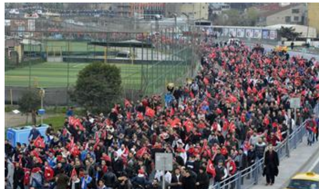
(HD紙インターネット版より)